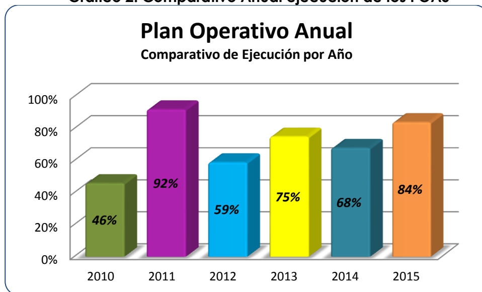
Gráfico 2: Comparativo Anual ejecución de los POAS